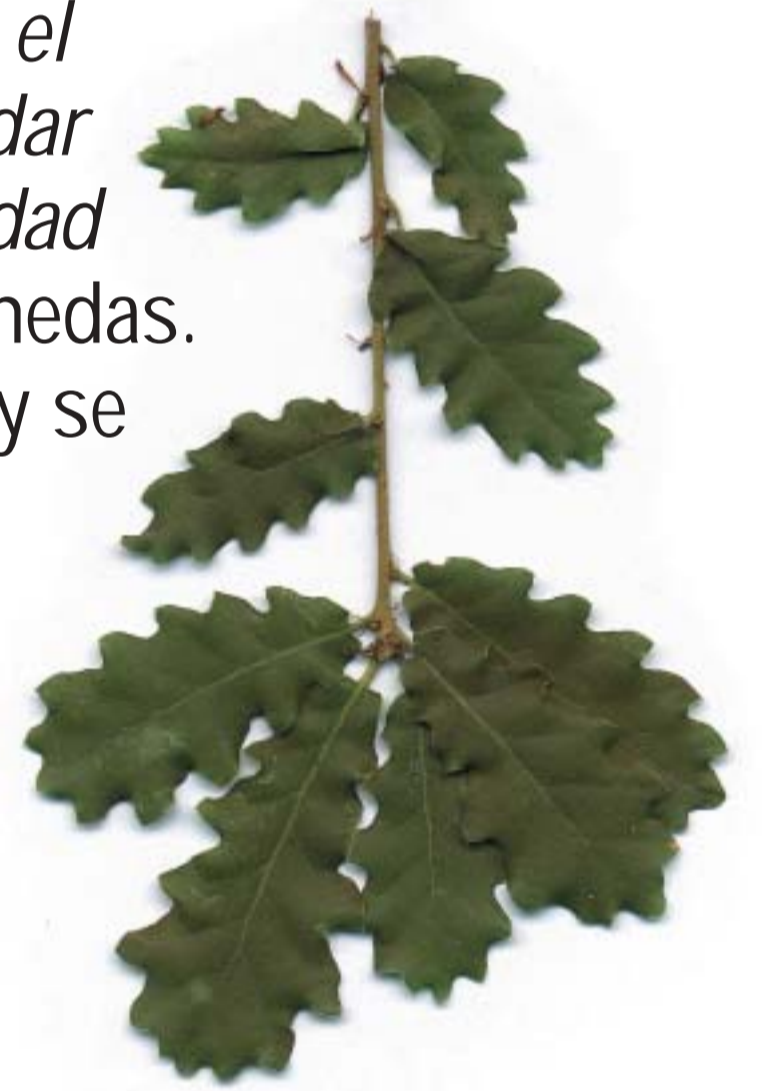
Quercus humilis , Roble pubescente, Ametz ilaunduna

Anozibar es un pueblo ligado a los fenómenos mágicos propiciados quizás por su situación apartada. Famosa es la fuente de Aingiruiturri, de la cuál se dice que "Debe de lavarse cara y manos con su agua y arrojar una moneda a la misma el día de San Juan para quedar libre de cualquier enfermedad de la piel". Después el cura recogía las monedas. Cuentan que un pastor robó las monedas y se vió afectado por la sarna de arriba abajo.