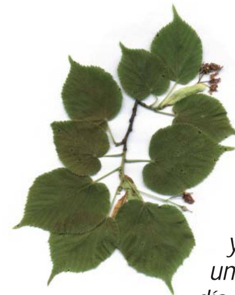
Tilia platyphyllos , Tilo de hoja grande, Ezki hostozabala

Anozibar es un pueblo ligado a los fenómenos mágicos propiciados quizás por su situación apartada. Famosa es la fuente de Aingiruiturri, de la cuál se dice que "Debe de lavarse cara y manos con su agua y arrojar una moneda a la misma el día de San Juan para quedar libre de cualquier enfermedad de la piel". Después el cura recogía las monedas. Cuentan que un pastor robó las monedas y se vió afectado por la sarna de arriba abajo.