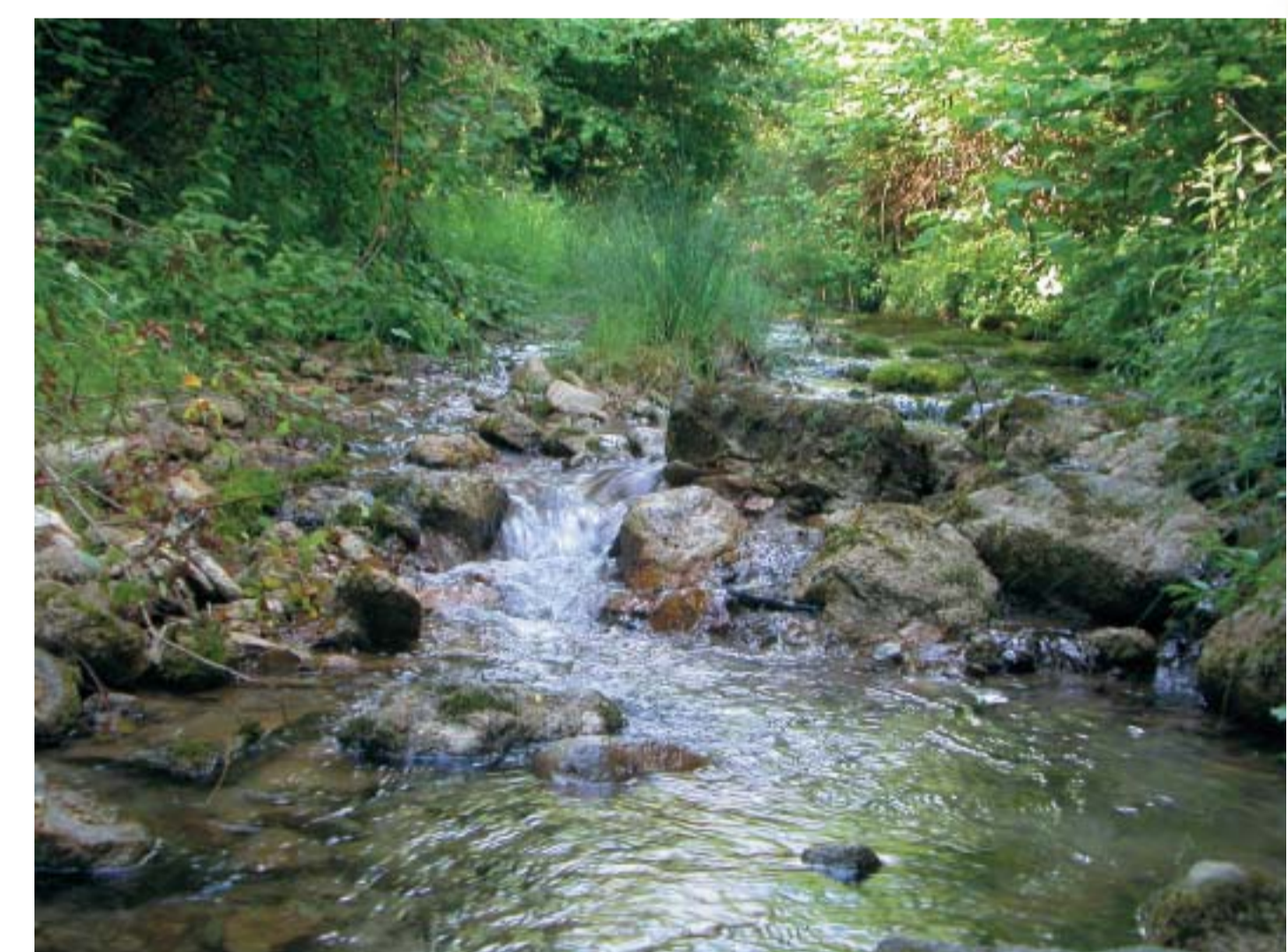
Regata de Aingiruiturri. Aingiruiturriko erreka