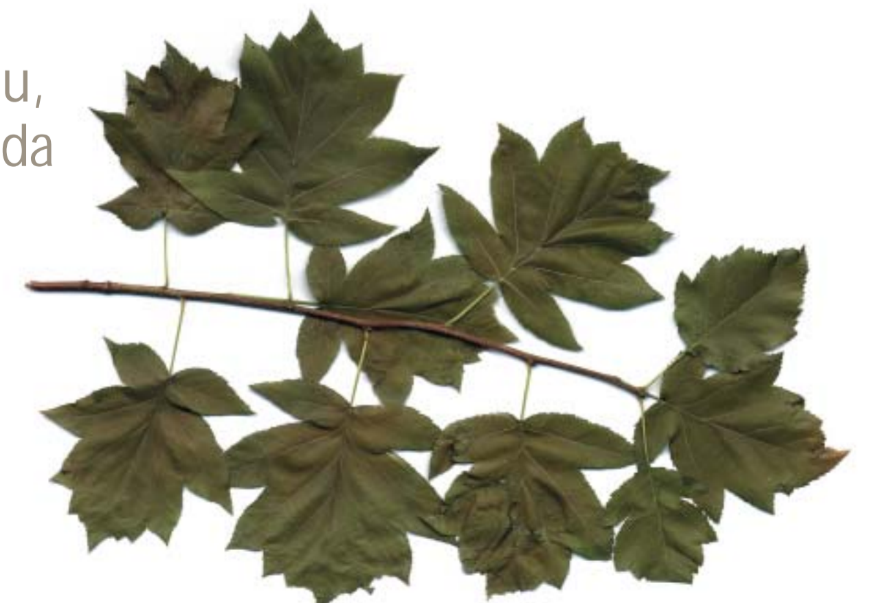
Sorbus torminalis , Mostajo, Basagurbea

Anozibar aztikeriarekin loturiko herria da; beharbada, bazterherria izateak horretarako bidea ematen duelako. Aingiruiturri sona handiko iturria da. Iturri horren inguruan badago honako esatera hau: Donibane egunean hango urarekin aurpegia eta eskuak garbitu, eta txanpon bat bota behar da iturri azaleko gaixotasunik ez izateko. Gero, apaizak txanponak biltzen zituen. Diotenez, artzain batek txanponak lapurtu zituen, eta legenak jo zuen goitik behera.