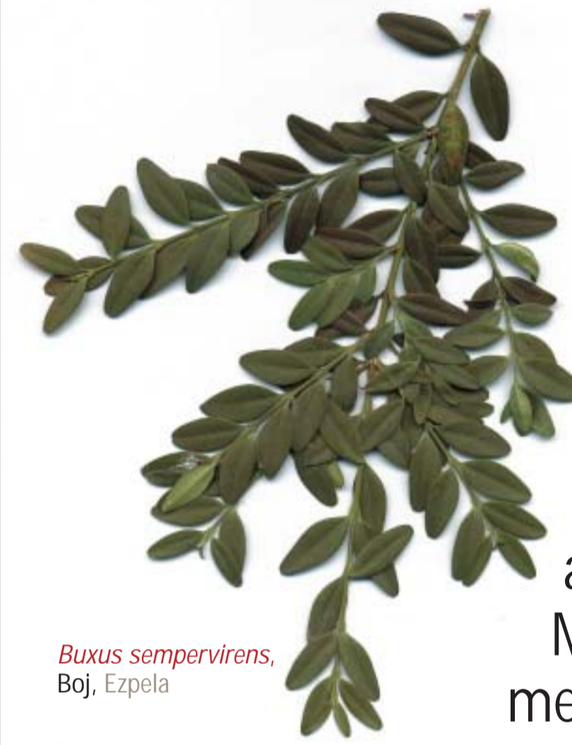
Buxus sempervirens , Boj, Ezpela

El Valle de Odieta se asienta en una zona de transición entre las regiones atlánticas (al norte) y las mediterráneas (al sur). Prueba de ello es la vegetación que lo habita, pues, aun existiendo especies típicamente atlánticas como robles y hayas, aparecen otras propias de estos ambientes de cambio como el Arce de Montpellier y hasta otras claramente mediterráneas como la Encina.