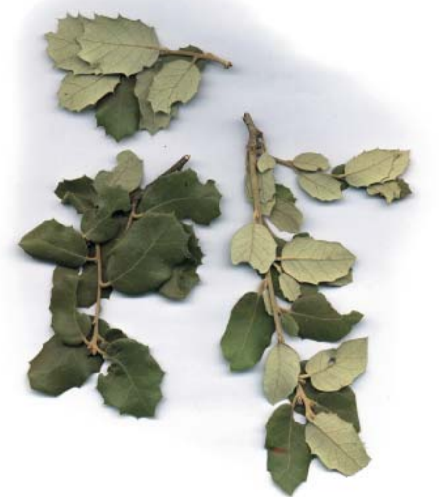
Quercus ilex , Encina o Carrasca, Artea