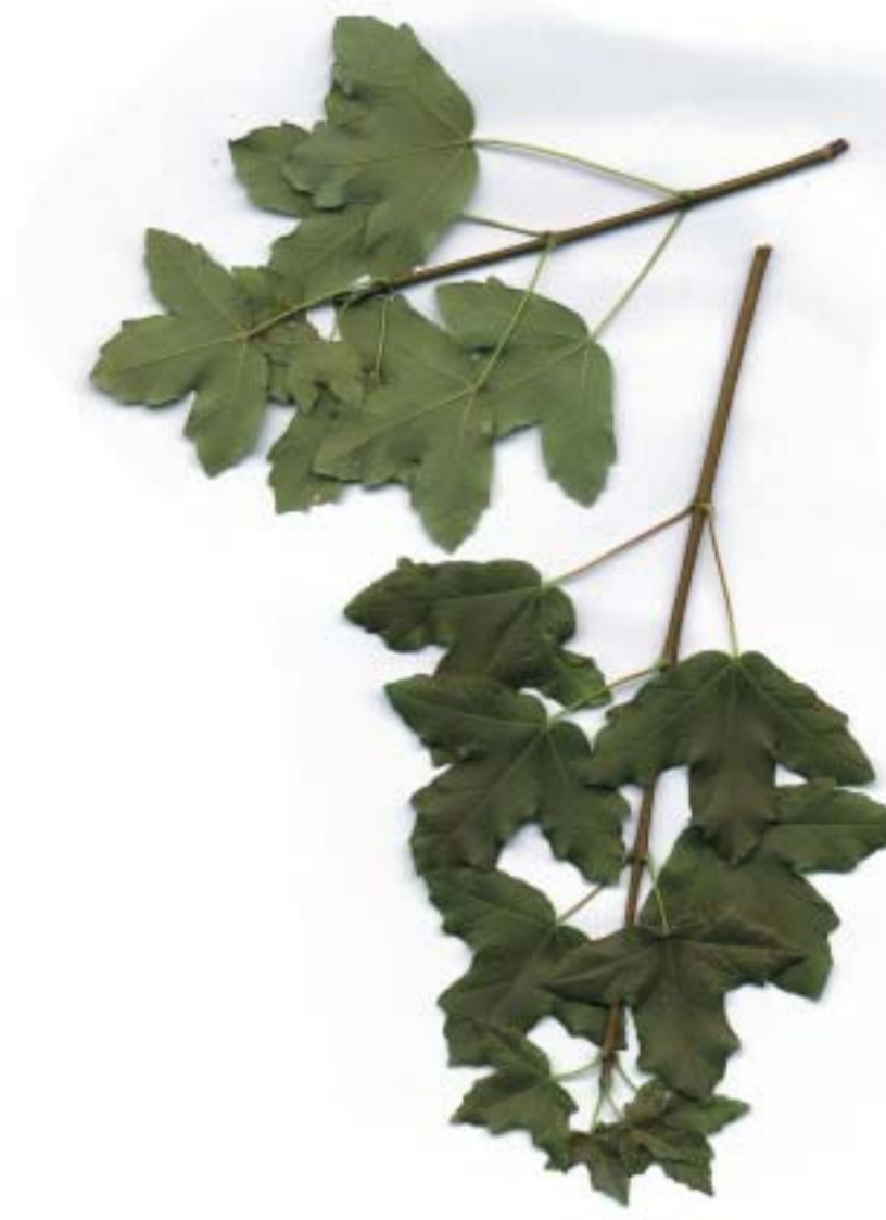
Acer monspessulanum , Arce de Montpellier, Eihar frantsesa

El Valle de Odieta se asienta en una zona de transición entre las regiones atlánticas (al norte) y las mediterráneas (al sur). Prueba de ello es la vegetación que lo habita, pues, aun existiendo especies típicamente atlánticas como robles y hayas, aparecen otras propias de estos ambientes de cambio como el Arce de Montpellier y hasta otras claramente mediterráneas como la Encina.