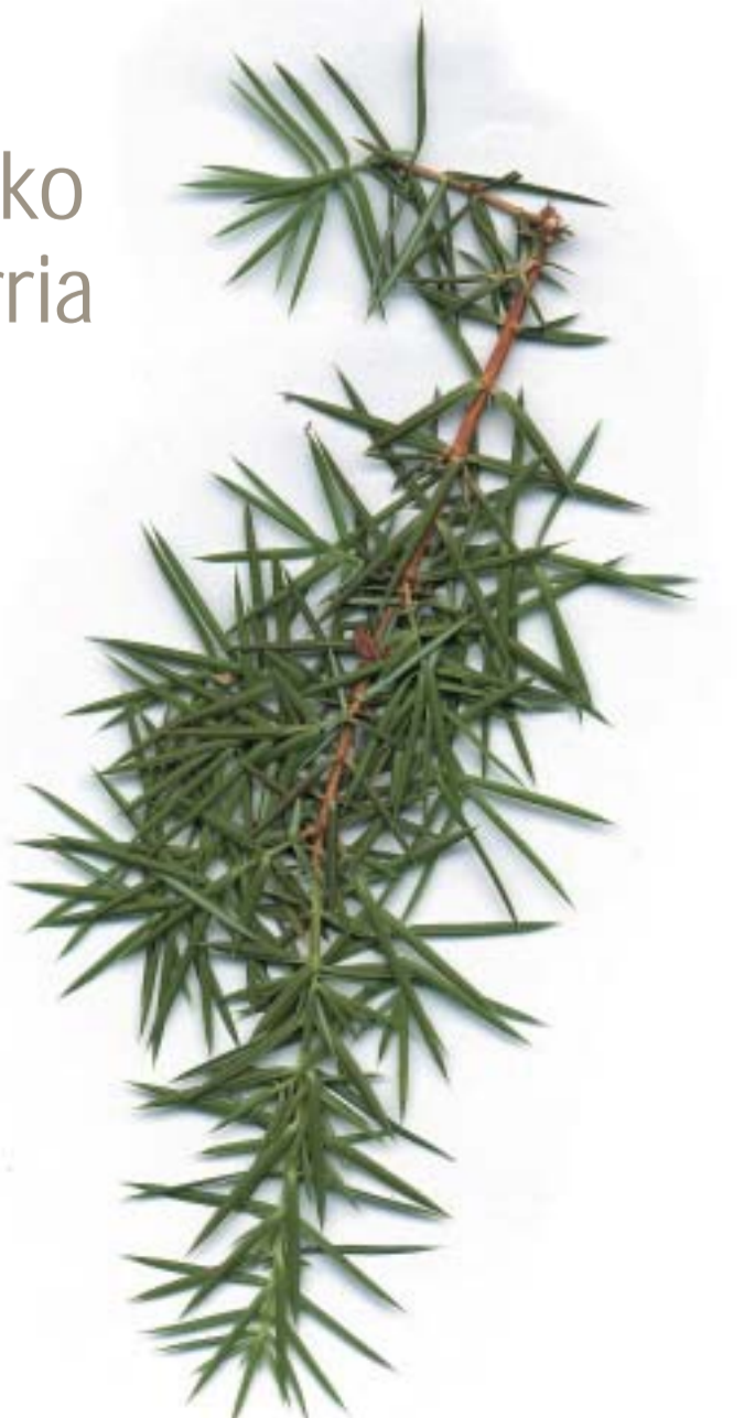
Juniperus communis , Enebro común, Ipar-ipurua

Odieta bailara atlantiar (iparraldean) eta mediterraniar (hegoaldean) eskualdeen arteko pasagunean kokatzen da. Horren adierazgarria da bertan sortzen den landaretza; izan ere, atlantiar eskualdeetako ohiko espezieak (haritzak eta pagoak) badaude ere, aldaketa giroko beste batzuk agertzen dira (ihar frantsesa), eta are argi eta garbi mediterraniarrak diren beste batzuk ere (arte kasu).