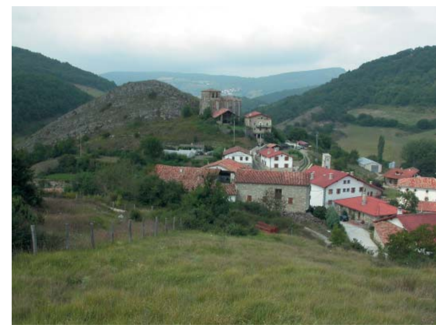
Gaskue al abrigo de la peña Argain.