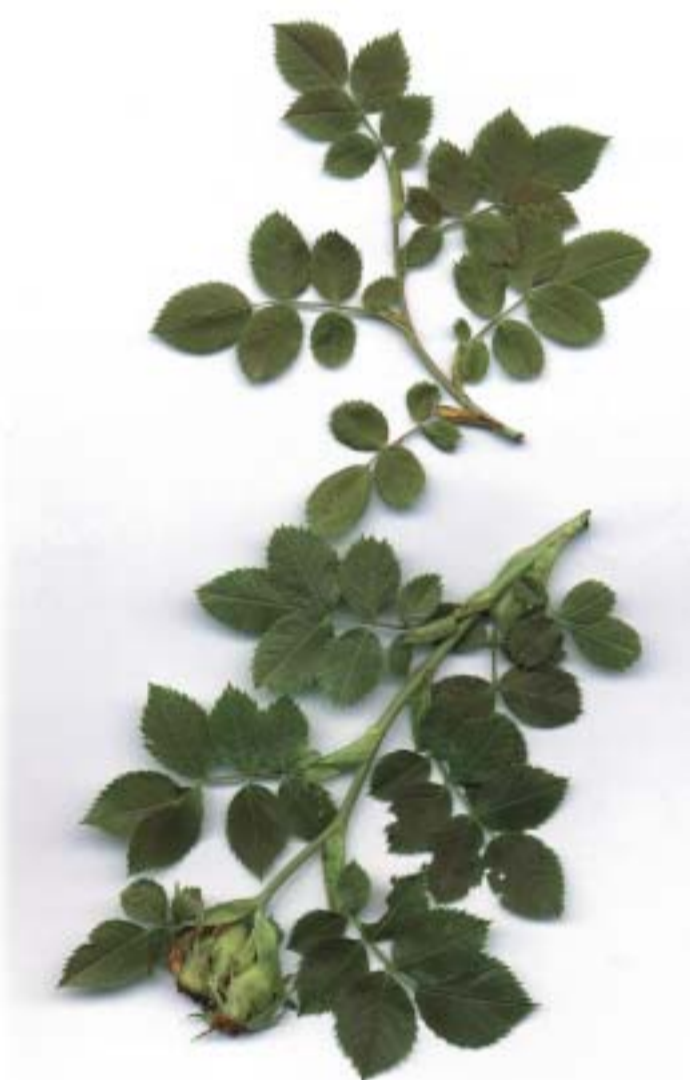
Rosa sp. , Rosal silvestre, Arkakaratsa