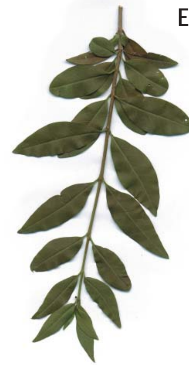
Ligustrum vulgare , Aligustre, Arbustu arrunta

Gaskue se sitúa en un pequeño alto, al abrigo de la peña de Argain, flanqueada por las regatas de San Urbano y de Arostegi. La presencia destacada de la Parroquia de San Esteban, una iglesia del siglo XVI, en lo alto de la ladera modela la silueta del pueblo.