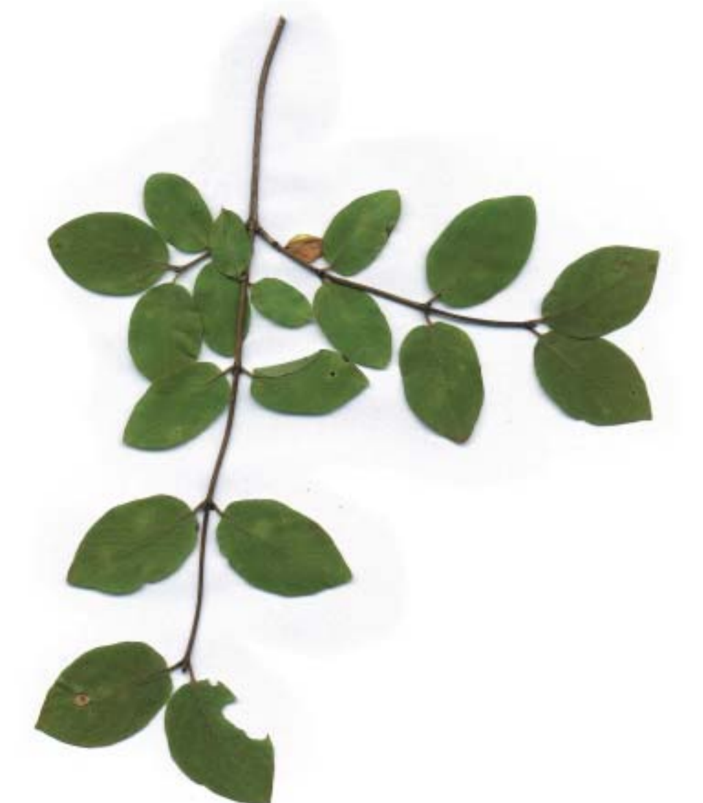
Lonicera xylosteum , Madreselva, Atxaparra

Gaskue muino txiki batean dago, Argain haitzaren babespean, San Urbano eta Arostegi errekek alboan dituela. Done Eztebe Parrokia, XVI. mendeko eliza, mendi-hegalaren goiko aldean nabarmentzen da, eta forma berezia ematen dio herriari.