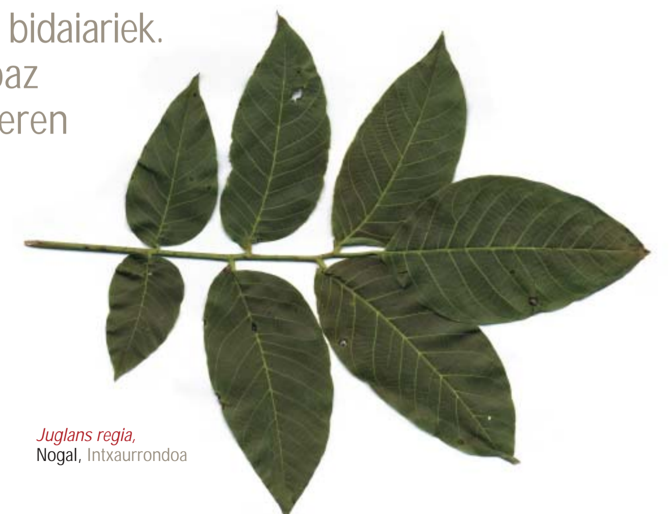
Juglans regia , Nogal, Intxaurrendoa

Ostitz puntu estrategiko batean dago, Belate (Baztan bailara) eta Iruñea arteko erdibidean. Antzintatik maiz erabiltzen zuten ibilbide hau Frantziatik Nafarroako hiriburura joaten ziren bidaiariek. Ibilbide horretatik doaz Baztango Done Jakueren bidea eta N-121 errepidea.