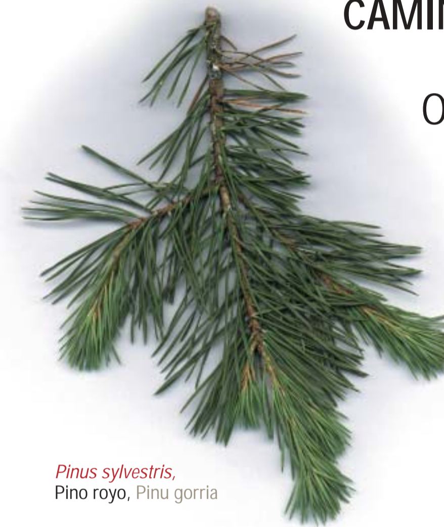
Pinus sylvestris , Pino rojo, Pinu gorria

Ostiz está situado en un punto estratégico a medio camino entre Belate (Valle de Baztán) y Pamplona. Desde antiguo era una ruta frecuentada para los viajeros que, procedentes de Francia, se dirigían a la capital navarra. Esta ruta la recorren el Camino de Santiago Baztanés y la carretera N-121.