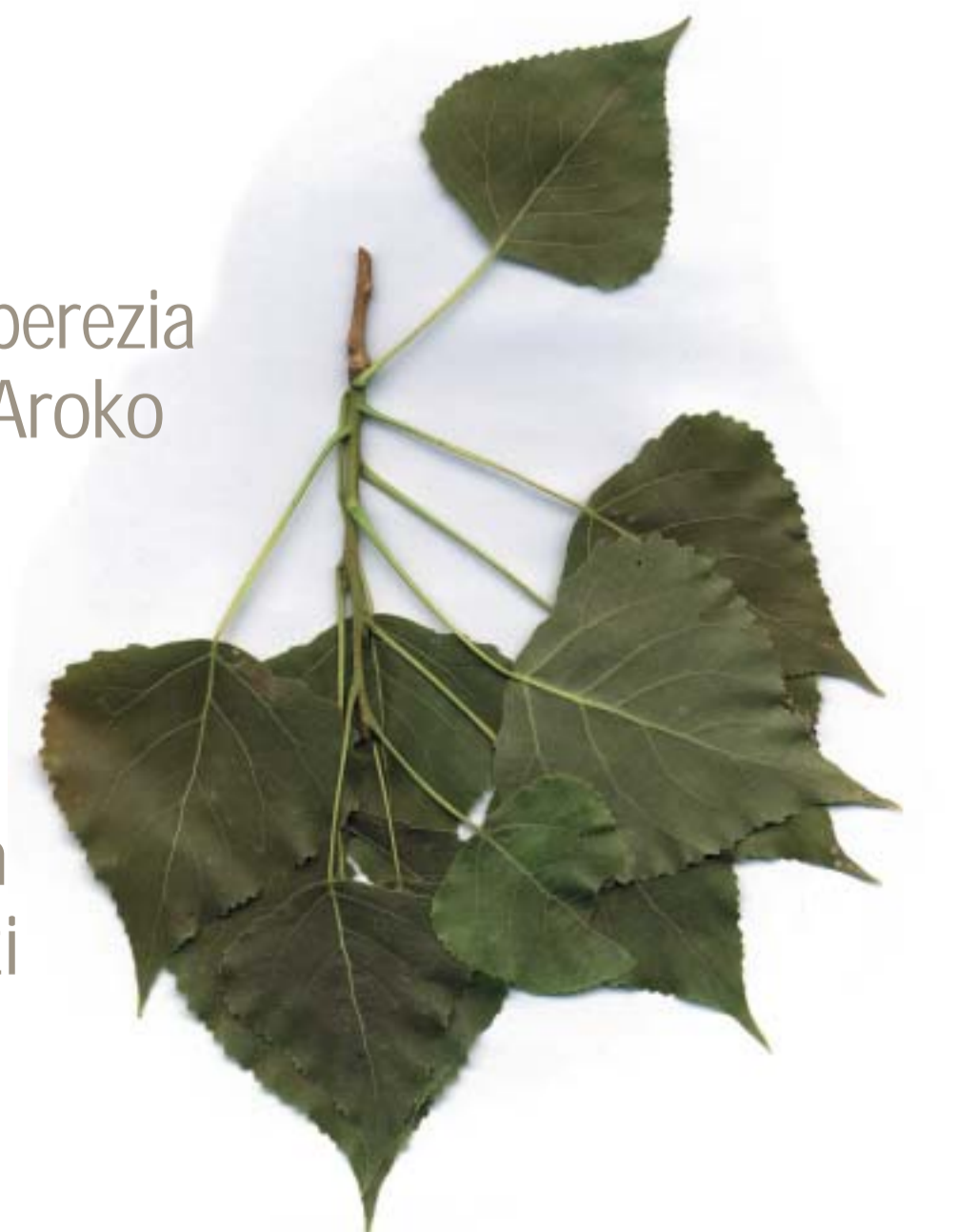
Populus nigra , Chopo, Makala

Ziaurritz ibaiertzean dago. Aipamen berezia merezi du hango zubi bikainak; Erdi Aroko estilokoa da, bost begi ditu eta inguruko bailaretakoan artean luzeenetakoa da. Ziaurritzeko errota eguneguz xehetu egiten zuen eta gauz argia ematen zuen, 1.940. urtean lan egiteari utzi zion arte.