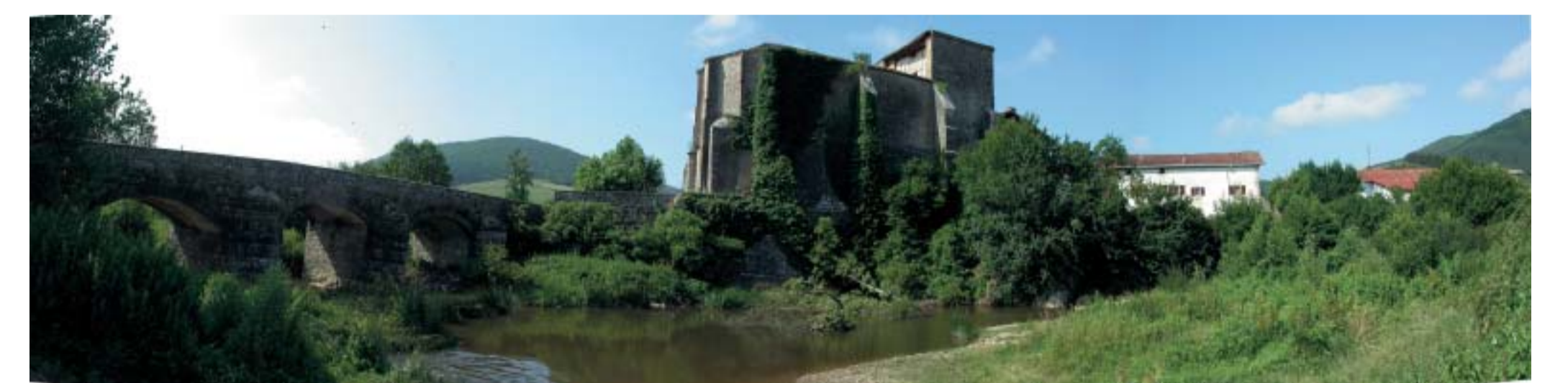
Iglesia de Ziaurritz y puente sobre el río Ultzama Ziaurritzko eliza eta Ultzama ibaiaren gaineko zubia